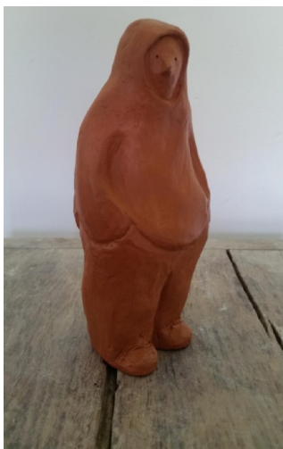
Waiting for the bus

Sculptures Cécile Dalnoky www.ceciledalnoky.fr/sculpture